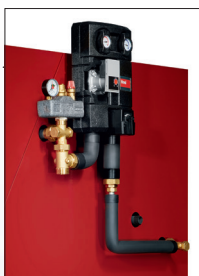
Ladegruppe für den Trinkwassererwärmer mit Hocheffizienzpumpe