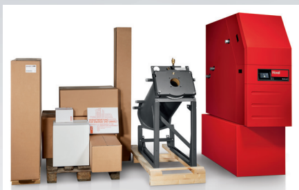
Zur Einbringung in enge Heizungskeller wird der MultiJet® LSP in handlichen Paketen geliefert.