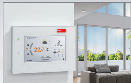
Komfortable Bedienung mit modernster TopTronic®-E-Systemregelung